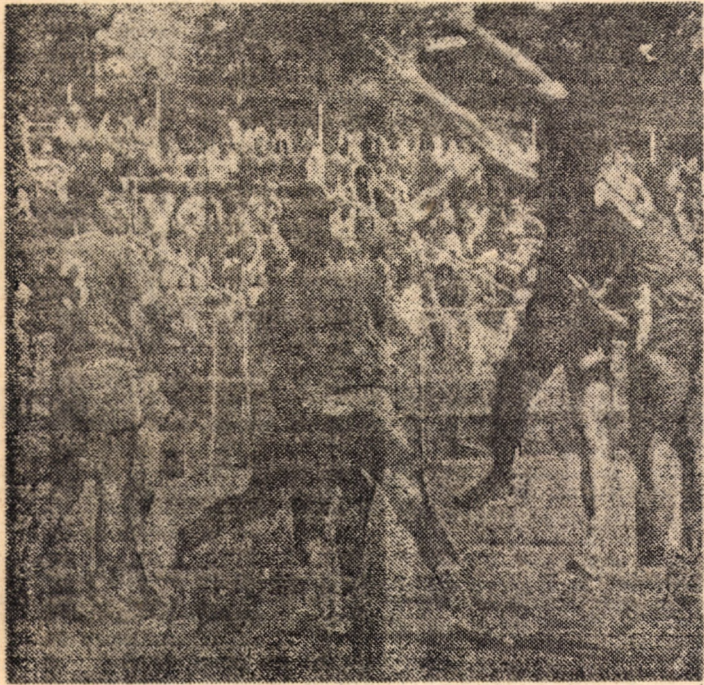
Imagine din partida amicală de handbal Independența Carpați Mirșa - "U" Craiova, un reușit test al divizionarilor A sibieni în vederea apropiatului debut al campionatului