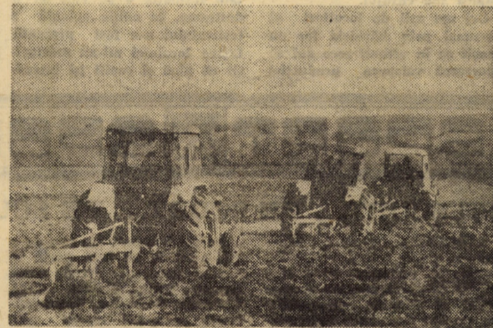
Acum, cea mai importantă lucrare, ce condiționează recoltele viitoare, o constituie arăturile de vară; o arătură de calitate se execută cu plugul în agregat cu grapă