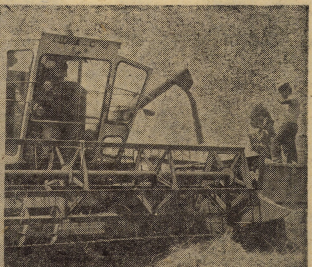
Unitățile cooperatiste din componența Consiliului unic agroindustrial și cooperatist Avrig obțin rezultate tot mai bune pe „șantierul” recoltei. În imaginile prezen-