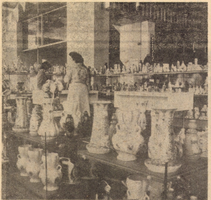
Prin magazinul universal „Dumbrava”, cea mai mare unitate comercială de pe cuprinsul județului Sibiu, cetățenilor le sînt oferite mărfuri de o mare diversitate. În foto: raionul cu articole de sticlărie, ceramică și porțelan, menite să înfrumusețeze interioarele locuințelor noastre.

urmat de o proiecție de diapozi-tive pe care pionierii Școlii generale Șeica Mare îl dedică zilei de 23 August. În 12 august a.c., pionierii din Tilișca se vor întîlni în cadrul școlii pentru vizionarea unor diapozi-tive sub genericul „Gînduri frumoase pentru toții copiii lumii”. În aceeași zi, comandamentul Școlii generale nr. 10 Sibiu organizează o drumeție pe traseul Cisnădie — Cisnădioara — Rășinari. „Copilăria noastră fericită sub soarele lui August” este genericul expozi-ției de desene organizată de pionierii Școlii generale nr. 19 Sibiu. „România — leagăn sfînt” se intitulează recitalul de poezie susținut în 14 august de membri ai cercului de creație literară al Școlii generale Șeica Mare. Pionierii de la Școala generală Ocna Sibiului își vor înmănușia gîndurile de pace în cadrul momentului poetic „Inscripții de pace”. La Școala generală Hoghilag va avea loc manifestarea „Tineretul României socialiste — factor activ în lupta pentru pace și progres”. În 15 august a.c., pionierii claselor a II-a de la Școala generală nr. 5 din Sibiu vor vizita Muzeul tehnicii populare din Dumbrava Sibiului.