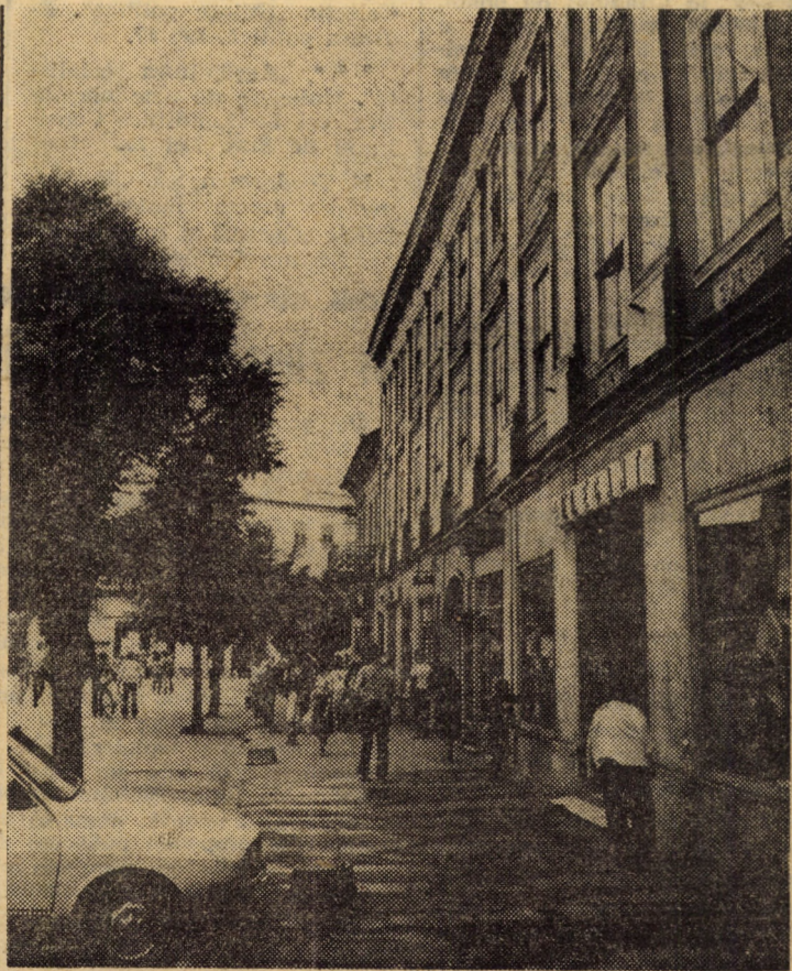
Secvență din centrul municipiului Mediaș

Cu prilejul împlinirii a 150 de ani de la nașterea cărturarului român Alexandru Odobescu — literat, istoric și arheolog, om de vastă cultură și om politic — Biblioteca „Astra” a deschis o expoziție documentară ce-l prezintă pe cărturarul român în ipostaza sa de scriitor, om de știință, reșinind, totodată, și trecerea sa prin Sibiu în anul 1860. Instrucțivă prin modul de organizare și prin exponatele prezentate, expoziția constituie un indemn adresat sutelor de cititori de a cerceta opera cărturarului, galeria de aur a științei și culturii românești.