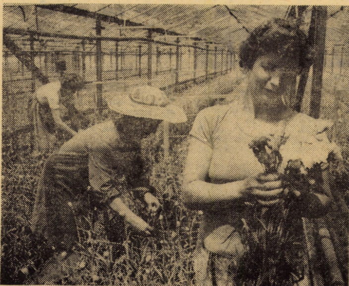
Din suprafața totală a întreprinderii sere din Dumbrăveni, cca 40 la sută este destinată culturii floricole. Anual de aici sînt expediate beneficiarilor cca 16—18 milioane fire de flori

Am relatat cîteva aspecte ale experienței dobîndite de organizațiile de partid din municipiul Mediaș în munca permanentă cu tinerii comunisti de vîrstă utescistă, experiență care, desigur, se adaugă cu folos celei dobîndite de organizațiile de partid din alte orașe ale județului, care dovedește cu prisosință că tineretul reprezintă cu adevărat o forță în îndeplinirea exemplară a tuturor sarcinilor.