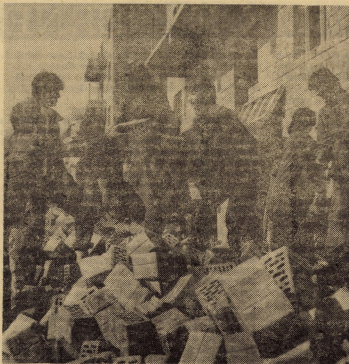
Elevi ai Liceului de construcții nr. 7 din Sibiu la muncă patriotică în cartierul „Valea aurie”

secretar adjunct al Comitetului comunal de partid, Șelimbăr