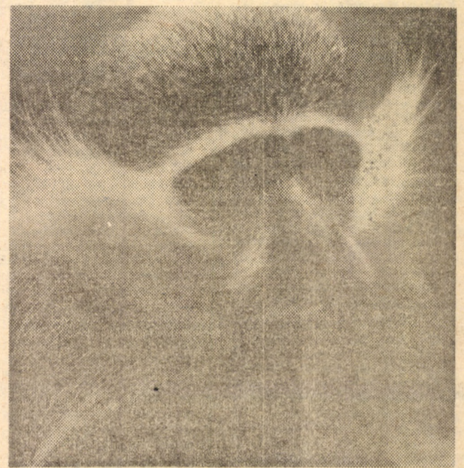
„Coafură de modă nouă”