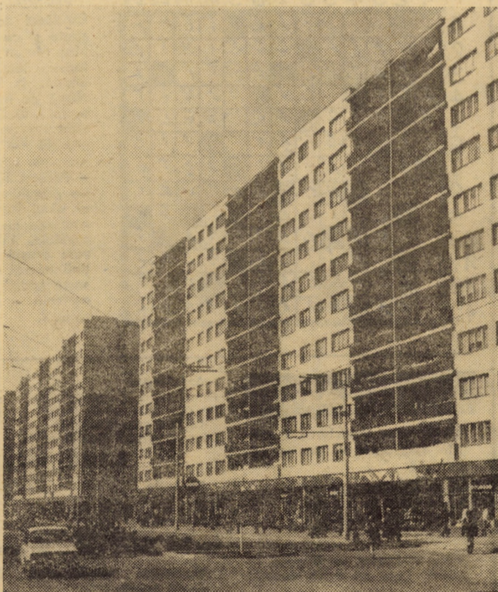
An de an peisajul arhitectonic din municipiul Sibiu s-a îmbogățit cu noi și impunătoare construcții de locuințe dintre care vă prezentăm pe cele din b-dul Mihai Viteazul — cartierul Hipodrom