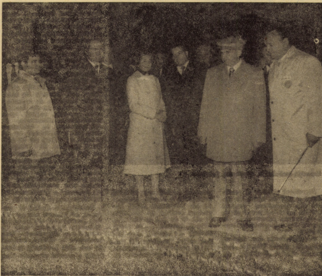
În mijlocul constructorilor de mașini de la întreprinderea „Independența” din Sibiu

unei formații de lucru din secția de utilaj metalurgic.