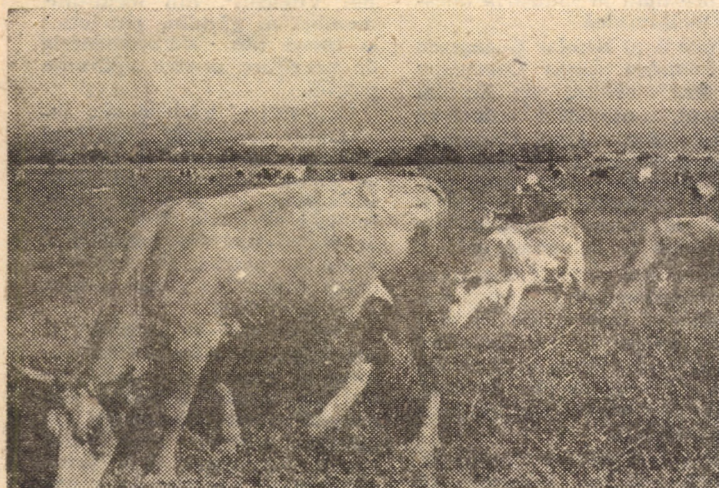
180 de zile pe an, vacile cu lapte sînt furajate cu masă verde, pe miile de hectare pajiști naturale existente pe teritoriul județului nostru. În această perioadă, animalele, în afara unui furaj vitaminos beneficiază de mișcare și soare, stimulente de neînlocuit. În imagine vaci pe pășunea C.A.P. Avrig