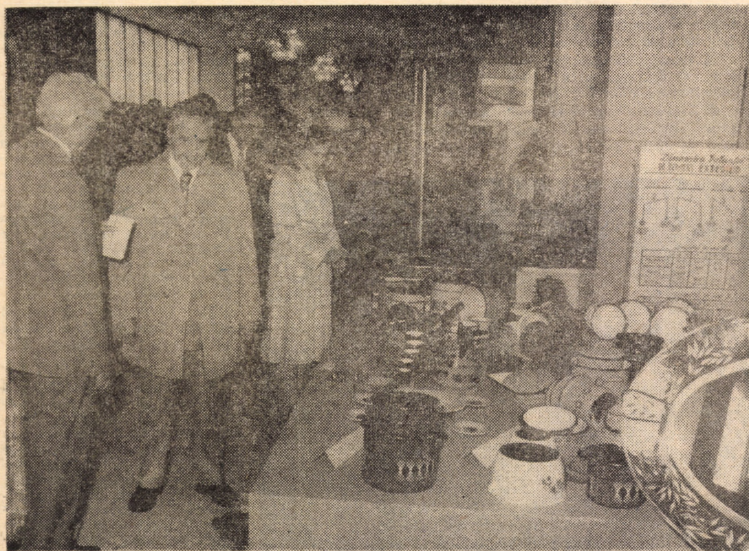
Expoziția realizărilor economiei județului