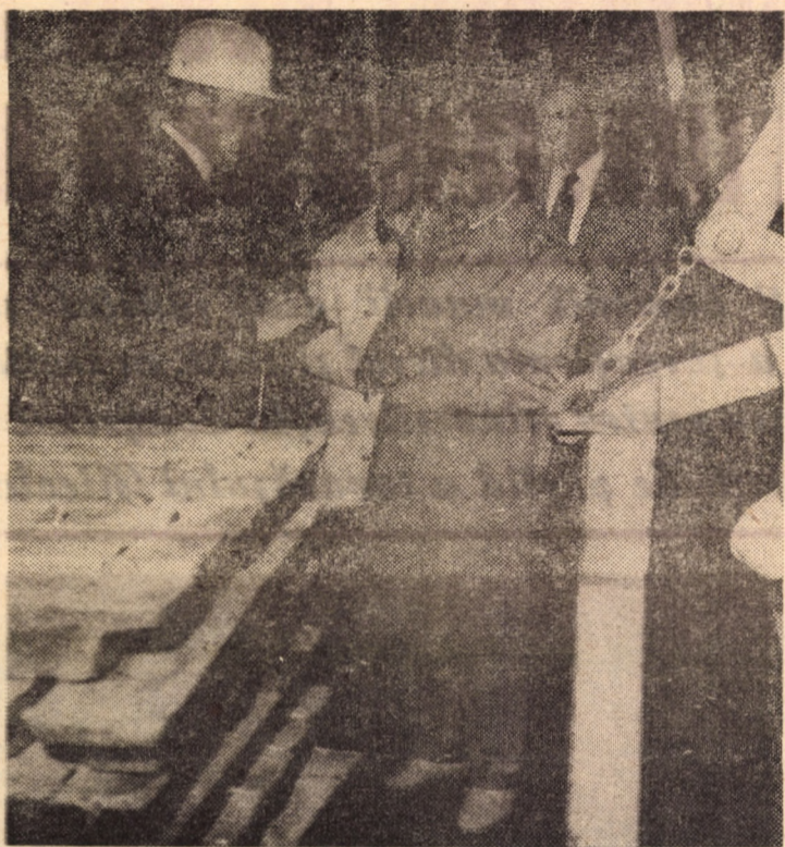
La I.M.M.N. Copșa Mică — puternic centru al metalurgiei românești

partidului — cu succese deosebite în muncă. La plecarea, tovarășul Nicolae Ceaușescu, adresîndu-se muncitorilor, inginerilor și tehnicienilor întreprinderii, locuitorilor din Copșa Mică prezenți în mare număr la locul de decolare a elicopterului prezidențial, i-a felicitat călduros pentru succesele dobîndite și a urat colectivului acestei întreprinderi să obțină rezultate tot mai bune în activitatea lui de mare însemnătate pentru economia țării. Vizita de lucru a tovarășului Nicolae Ceaușescu și tovarășei Elena Ceaușescu în județul Sibiu a continuat la Medias, străvechea vatră de civilizație românească, astăzi puternic centru industrial al județului și al țării, care realizează în unitățile sale o gamă variată de produse solicitate de economia națională.