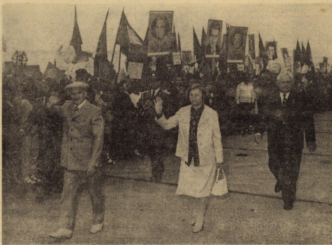
Entuziastă primire în municipiul de pe Cibin, simbol al recunoștinței și dragostei noastre pentru conducătorul iubit

Aceste simțăminte și această nestrămutată încredere s-au manifestat cu deosebită pregnanță în timpul primirii tovarășului Nicolae Ceaușescu, a tovarășei Elena Ceaușescu, pe aeroportul din Sibiu. Mii și mii de locuitori ai acestor străvechi meleaguri românești, încărcate de fapte istorice și de muncă intrate pentru totdeauna în conștiința poporului — muncitori, țărani, intelectuali, tineri și vîrstnici, români, germani și maghiari — au venit aici să exprime dragostea și stima ce o poartă conducătorului încercat al partidului și statului pentru tot ce a făcut și face ca țara întreagă, toate localitățile urbane și rurale să cunoască o puternică dezvoltare multilaterală. Primirea deosebită, entuziastă, a conferit acestei întâlniri dimensiuni și atributele unei autentice sărbători. Steaguri tricolore și roșii, portrete ale tovarășului Nicolae Ceaușescu, ale tovarășei Elena Ceaușescu, chemări la adresa eroicului nostru partid comunist și a secretarului său general, a patriei noastre socialiste, flori,