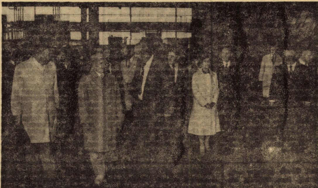
În mijlocul harnicilor constructori de mașini de la I.M. Mirșa

La plecare, tovarășul Nicolae Ceaușescu a adresat