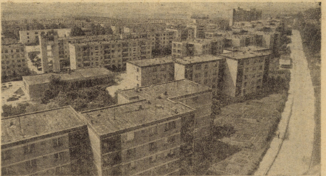
Cea mai mare realizare edilitară a orașului Mediaș, din ultimul deceniu, o reprezintă ridicarea cartierului Gura Cimpului, unde mii de familii ale oamenilor muncii au asigurate condiții moderne de locuit

șu”, „Relee”, „8 Mai”, „Vitrometan” ș.a. Spre exemplu, la „Emailul roșu” au fost reintroduse în procesul de producție 381 tone materiale recuperabile, valorificîndu-se, în același timp, 132 tone accesorii pentru vase emailate. Și exemplele ar putea continua.