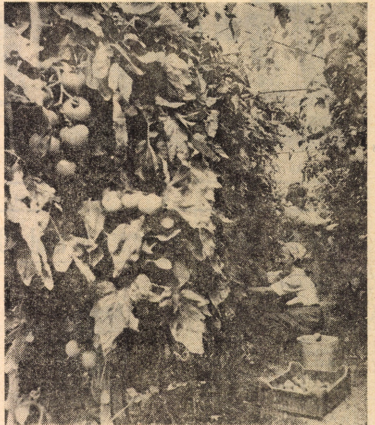
Munca harnicului colectiv de la întreprinderea sere Dumbrăveni, depusă în lunile din urmă se concretizează în prezent, printr-o bogată recoltă de legume. Iată-i surprinși la recoltarea tomatelor