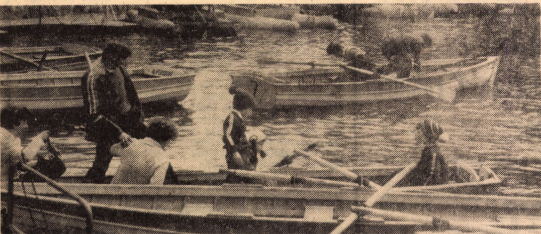
O tentantă invitație pentru duminică: plimbare cu barca în Dumbrava Sibiului