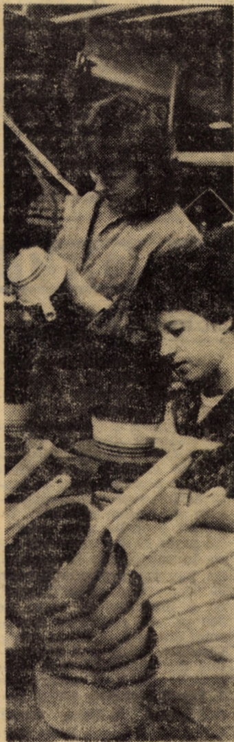
Decorarea manuală a vaselor emailate, destinate exportului, în secția finisat a întreprinderii „Emailul roșu”. Medias, constituie o operație de mare finețe