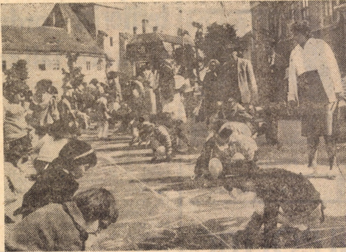
Ieri a fost 1 Iunie, ziua tuturor copiilor. Ne-am amuzat alături de ei, am participat la serbările lor în școli sau grădinițe, la „marele” concurs desfășurat în Piața Republicii din Sibiu. Dar să lăsăm imaginile fotoreporterului Fred Nuss să vorbească...