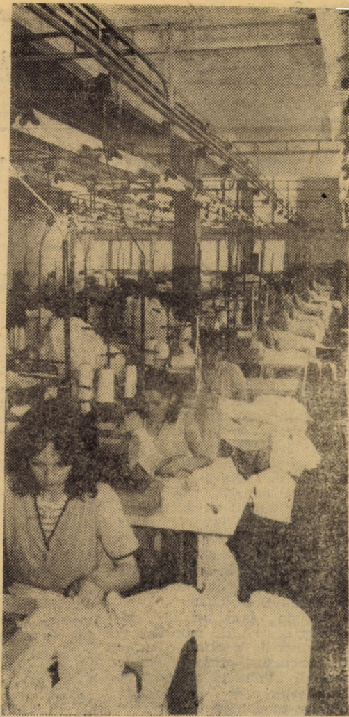
Vedere parțială a sălii confecționat de la sectorul II al întreprinderii „7 Noiembrie” din Sibiu unde, recent, fluxul de fabricație a fost reorganizat în întregime