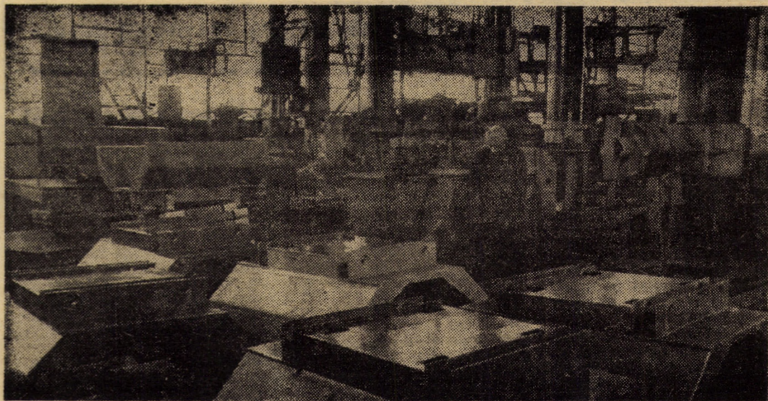
Finisarea componentelor unor utilaje de mari dimensiuni în atelierul de montaj al cazangeriei întreprinderii „Independența” Sibiu