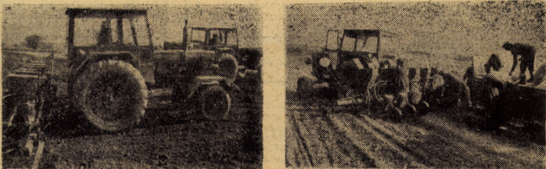
Secvențele de mai sus reprezintă imagini întîlnite cu cîteva zile în urmă, la C.A.P. Șura Mare, ferma Hambo, unde se însămintă porumbul.

Participă: ingineri, tehnicieni, subingineri, tehnicieni și proiectanți.