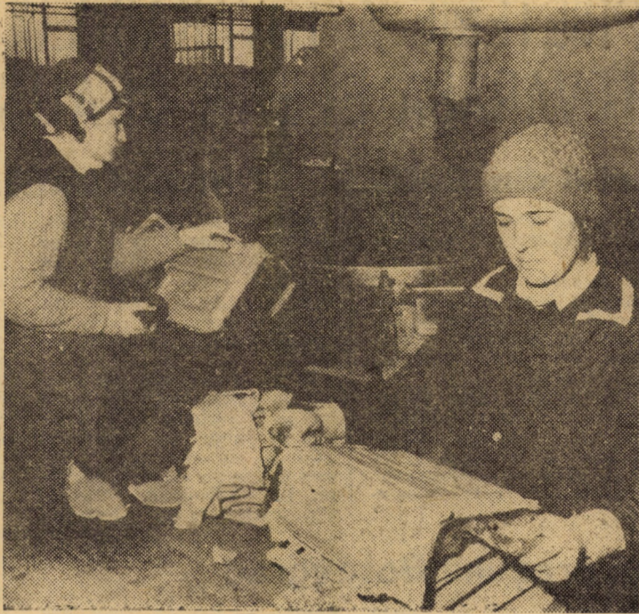
Automat pentru producerea cahelelor de teracotă la întreprinderea de produse ceramice „Record” din Sibiu