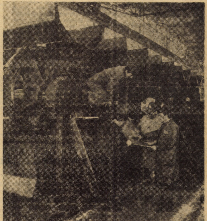
În imagine: Secția cazangerie a întreprinderii „Independența” unde, înainte de a fi livrate beneficiarului extern, noile utilaje sînt minutios verificate și controlate