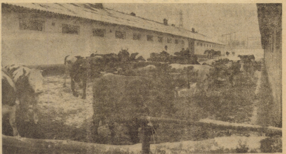
În vederea pregătirii animalelor pentru perioada stabulației libere, în fermele I.A.S. Sibiu, în zilele în care condițiile meteorologice o permit, acestea sînt scoase în padocuri

(Continuare în pag. a III-a) Lucian JIMAN