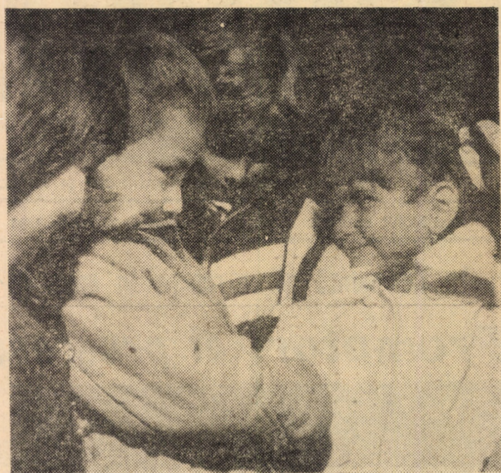
„Îmi pare bine de cunoștință...“