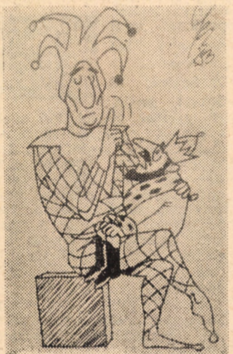
„Fără laude“. Caricatură expusă la salonul Festivalului de la Tolentino (Italia)

● Lămîiul „care vorbește“, sau, cel puțin care semnalizează el însuși că are nevoie de apă, este anul acesta vedeta Salonului agricol de la Paris.