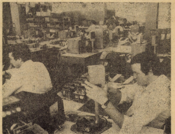
Vă prezentăm o imagine de la faza de verificare a releelor la standurile de probă în secția montaj a întreprinderii de rele Medias

(Continuare în pag. a III-a) Anchetă realizată de Nicolae ACHIM