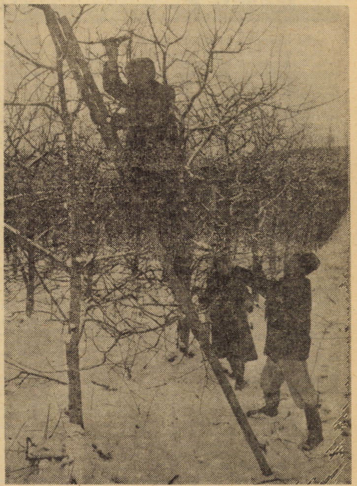
Tăieri de fructificare și rărire efectuate în plantațiile fermei nr. 1, aparținând Stațiunii de cercetare și producție pomicolă Sibiu — Cisnădie

Cu fierbinte dragoste și profund devotament, participanții la adunarea cu activul de partid și de stat din județul Sibiu se angajează, în numele tuturor locuitorilor acestor meleaguri, să acționeze cu înaltă răspundere patriotică pentru a-și spori contribuția la dezvoltarea generală a națiunii, la asigurarea sănătății, tineretii și vigoriei poporului nostru, întimpinind cu rezultate deosebite în toate domeniile de activitate cea de-a 40-a aniversare a marii noastre sărbători naționale de la 23 August și cel de-al XIII-lea Congres al partidului“.