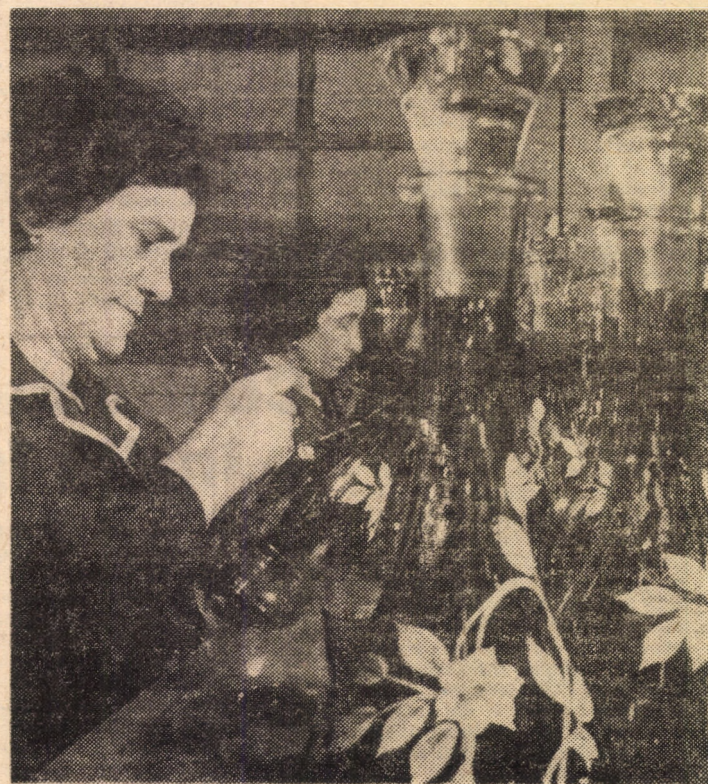
Artă și precizie — două caracteristici de bază ale lucrătoarelor din atelierul decor al întreprinderii „Vitrometan” Mediaș