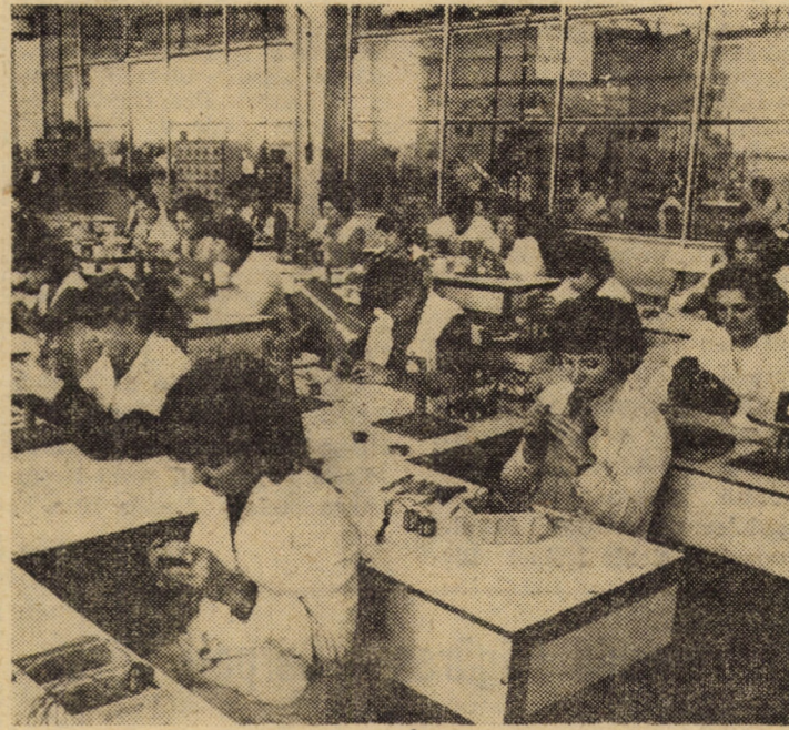
În noul atelier pentru producția de micromotoare al Întreprinderii de relee Mediaș lucrează în exclusivitate tinere fete și femei

Angajați cu toate forțele în infăptuirea neabătută a măsurilor adoptate de Plenara C.C. al P.C.R. din noiembrie 1983, sub semnul voinței unanime de a întâmpina cu noi și importante succese a 40-a aniversare a revoluției de eliberare socială și națională, antifascistă și antiimperialistă, precum și cel de-al XIII-lea Congres al partidului, oamenii muncii din cunoscuta întreprindere agnițeană nu vor precupeți nici un efort pentru realizarea exemplară a planului și angajamentelor asumate pe anul în curs. Astfel, anul acesta, evaluându-și posibilitățile și potențialul rezervelor interne, colectivul întreprinderii s-a angajat să realizeze peste plan, printre altele, o producție marfă industrială în valoare de 3 500 mii lei, o producție netă în valoare de 2 500 mii lei, depășirea productivității muncii cu 2 160 lei pe persoană, o reducere a consumului de fire textile de 2,5 t, economii de 12 Mwh energie electrică, 10 000 m.c. gaz metan, reducerea cheltuielilor totale la 1 000 lei producție marfă cu 0,5 lei.