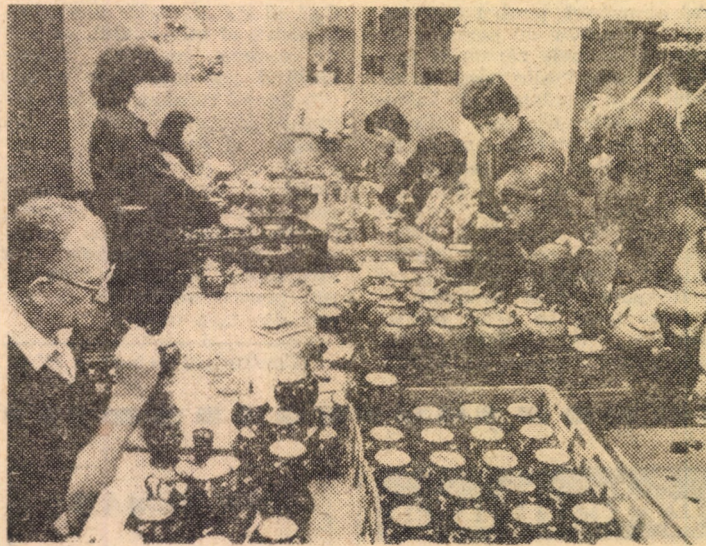
Aplicarea manuală a elementelor decorative la anumite produse emailate, de către creatorii talentați - este o operație recent introdusă în secția decor a întreprinderii „Emailul roșu”, Mediaș