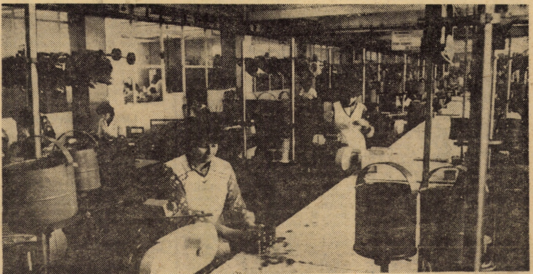
O muncă rezervată în exclusivitate femeilor la întreprinderea de relee Medias; realizarea bobinelor pentru diferite tipuri de relee