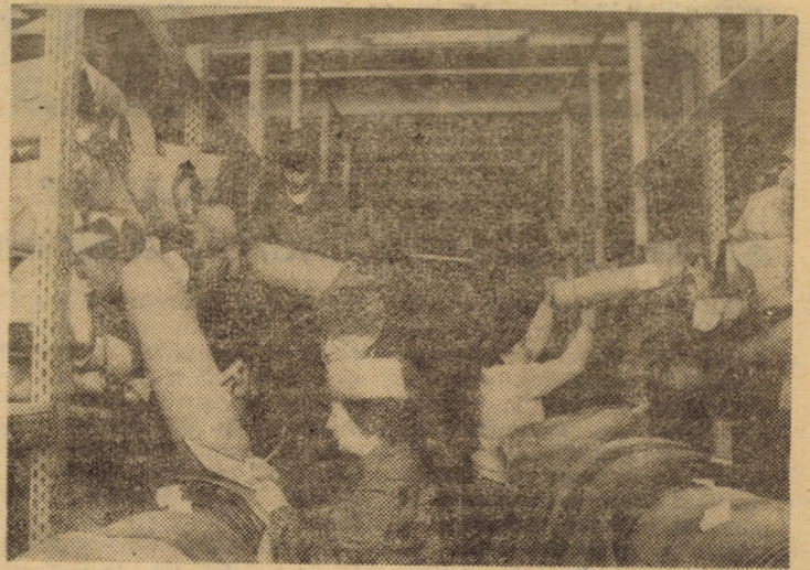
„13 Decembrie” Sibiu. În imagine magazia de produse finite (semi-fabricate)

— Curățirea și dezinfectia fîntinilor și adăpătorilor, împrăștierea bălegarului rămas din toamnă, dezinfectia și deparazitarea taberelor de vară. Fertilizări din timp cu îngrășăminte naturale și chimice. Acestea din urmă trebuie administrate în mustul zăpezii pentru ca în momentul scoaterii animalelor la pășune să nu apară intoxicații cu îngrășăminte chimice — rămase nedizolvate în sol. În tot timpul anului îngrijitorii de animale au datoria de a distruge scaieti în plină vegetație și nu după maturarea semintelor. Ciobanii vor muta strungile din 2 în 2 zile, funcție de cerințe, în așa fel încît țîrlirea să concure la îmbunătățirea pășunii și nu la distrugerea ei. Cred că este inutil să separăm atribuțiile medicului veterinar de obligațiile inginerului agronom. Din cele tratate mai sus se desprinde, necesitatea conlucrării și colaborării strînsă dintre cei doi factori de răspundere. Să nu uităm că pașiștea naturală este o avuție națională de o valoare inestimabilă, față de care toți deținătorii de animale au datoria de a o îngriji și ocroti în mod corespunzător.