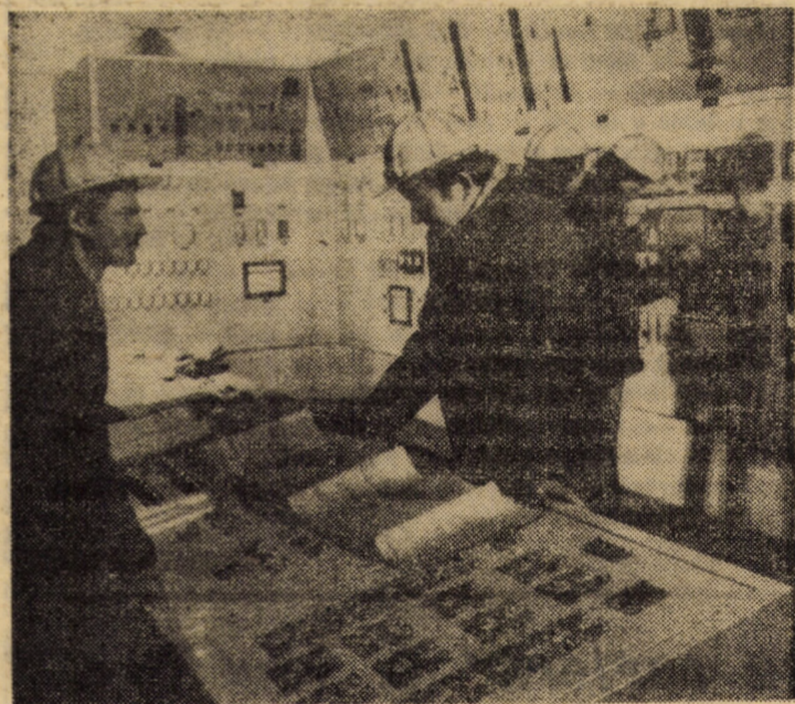
Instalații moderne de automatizare pentru acționarea și urmărirea procesului tehnologic la I.M.M.N. Copșa Mică