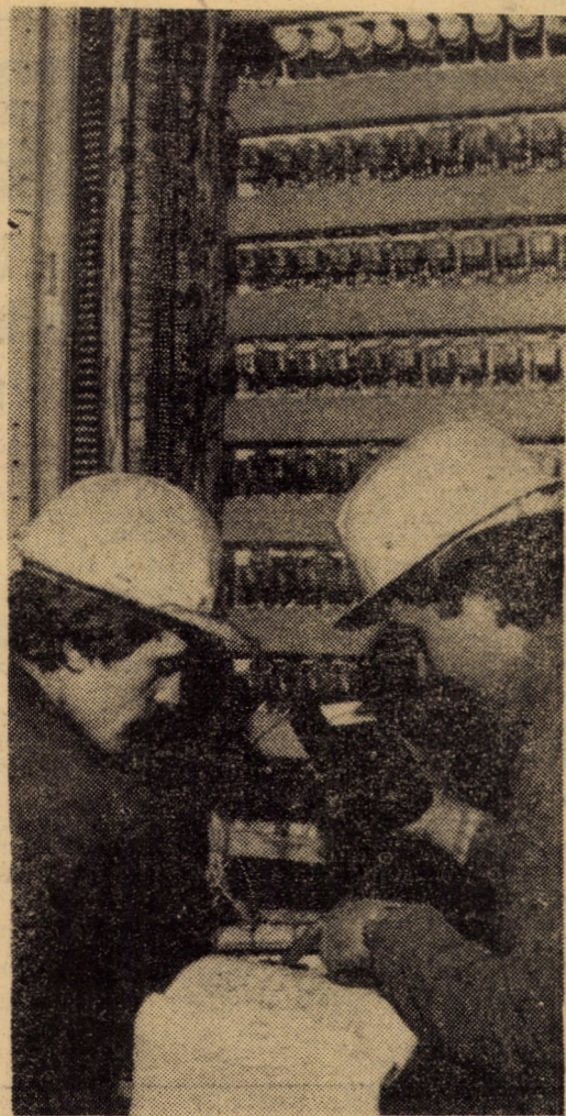
Menținerea într-o perfectă stare de funcționare a tuturor instalațiilor de automatizare, aferente procesului tehnologic cu flux continuu — iată o sarcină de căpătii a tehnicienilor de la I.M.M.N. Copșa Mică.