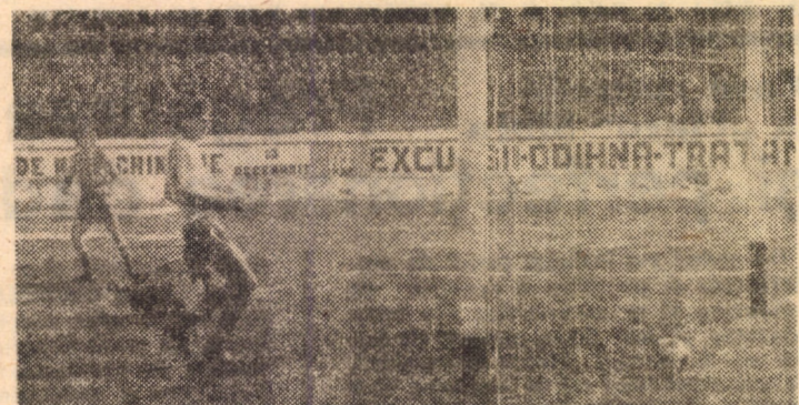
Gol în poarta oaspetilor!