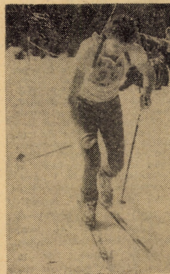
IN PAGINA A II-A SPORT...SPORT