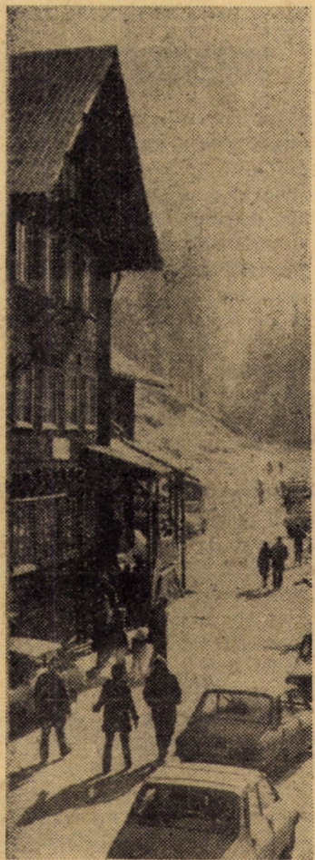
Pălînișul — o atracție permanentă pentru turiști