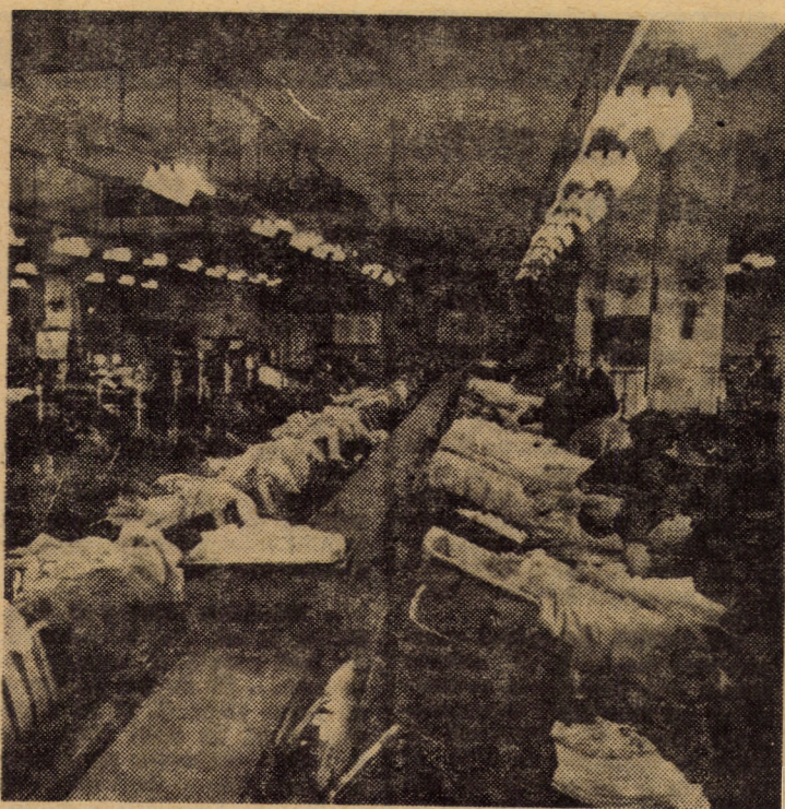
Atelierul confecției lenjerie, dotat cu benzi de lucru, dispunând de deservirea automată a locurilor de muncă, este atelierul cu cel mai mare număr de muncitori în cadrul întreprinderii „Drapelul roșu” din Sibiu