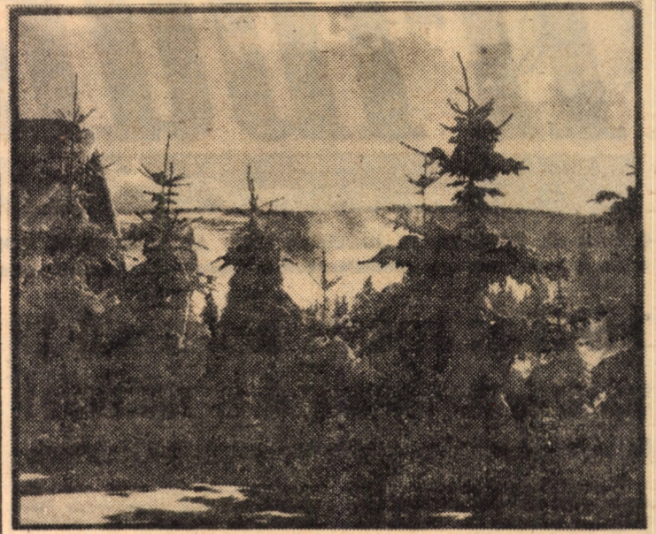
„A-nceput de ieri să cadă / Cite-un fulg...”