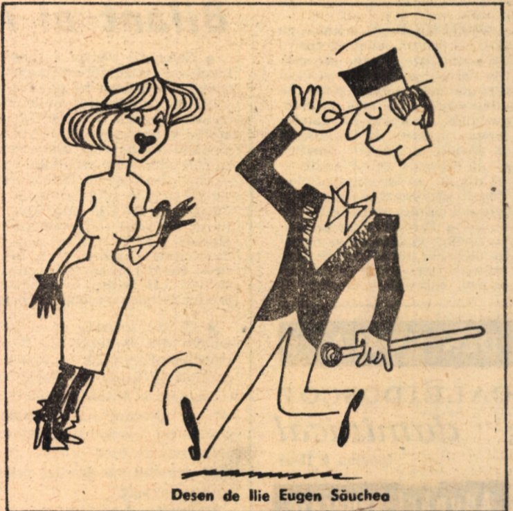
Desen de Ilie Eugen Săucea

tor, pentru orice vîrstă (Cinema Tineretului, orele 10; 12,30; 15).