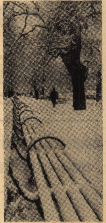
Parcul „Astra” din Sibiu, sub haina zăpezilor căzute din abundență în aceste zile.

Pentru ca aceste acțiuni să nu aibă un caracter rigid, ele sînt dublate sau alternate cu manifestări culturale artistice și spectacole tematice: Să ne einstim frunțașii, Acasă la navetiști, Oameni cu care ne mîndrim, ceea ce, ținînd seama de caracterul de emulație al actului artistic duce la generalizarea exemplului, stimuînd atitudinile noi față de muncă.