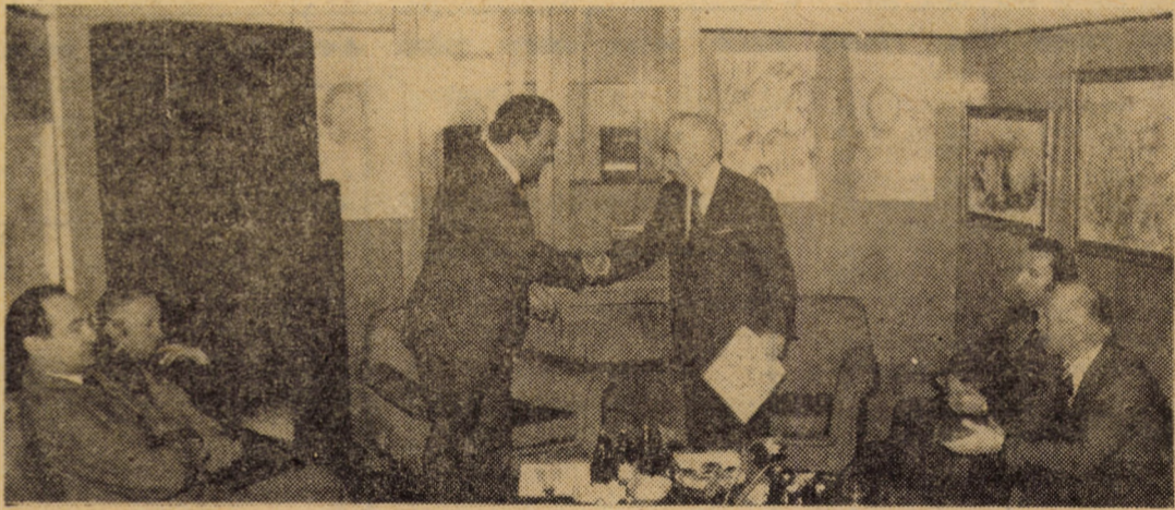
Recent, într-un cadru festiv, Filialele Sibiu a Uniunii societăților de științe medicale i-a fost acordată diploma pentru obținerea locu-

Răspunzînd chemării secretarului general al partidului, tovarășul Nicolae Ceaușescu, oamenii muncii din aceste domenii prioritare ale economiei naționale, celelalte categorii de oameni ai muncii din țară își intensifică permanent eforturile pentru creșterea puternică a producției și productivității muncii, mai buna organizare a activității, sporirea eficienței acesteia, folosirea rațională, la întreaga capacitate, a mașinilor și utilajelor, economisirea de materii prime, materiale, combustibili și energie, valorificarea superioară a materialelor refolosibile, întronarea fermă a ordinii și disciplinei la fiecare loc de muncă. Atitudine ce exprimă elocvent opțiunea clasei noastre muncitoare pentru materializarea exemplară a obiectivelor devenirii noastre socialiste și comuniste, hotărîrea de a întîmpina cu noi și onorante fapte de muncă cea de a 40-a aniversare a victoriei revoluției de eliberare socială și națională, antifascistă și antiimperialistă de la 23 August 1944 și cel de al XIII-lea Congres al Partidului Comunist Român.