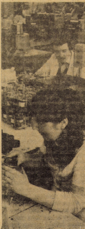
Operația de montaj a releelor de temporizare la întreprinderea de rele Medias

La aceeași unitate au fost introduse în fabricație o serie de noi tehnologii de mare productivitate și, totodată, economicitate. Între acestea figurează sertizarea prin deformare plastică a armăturilor pentru tuburile de cauciuc, executarea jentilor pentru autobasculantele grele în variantă rotată cu elemente ambutisate la cald, prelucrarea fuzetelor de la autobasculantele grele pe mașini unelte cu comandă program, cifrarea adîncă cu curenți de frecvență medie și executarea reperelor complexe pe centre de prelucrare.