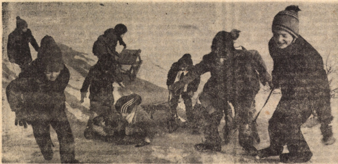
În sfârșit a venit o zăpadă mult visată...

Activitatea anului 1984 este subordonată celor două mari evenimente politice ale anului, sărbătorirea a 40 de ani de la victoria revoluției de eliberare socială și națională, antifascistă și antiimperialistă, de la 23 August 1944, și cel de al XIII-lea Congres al partidului. Sub semnul acestor două fundamentale momente politice Asociația scriitorilor sibieni și-a propus, în afara activității sale editoriale, omagierea împlinirii a 200 de ani de la războiul țărănesc condus de Horia, Cloșca și Crișan, 160 de ani de la nașterea lui Avram Iancu și a 100 de ani de la apariția „Tribunei” lui Slavici, organi-