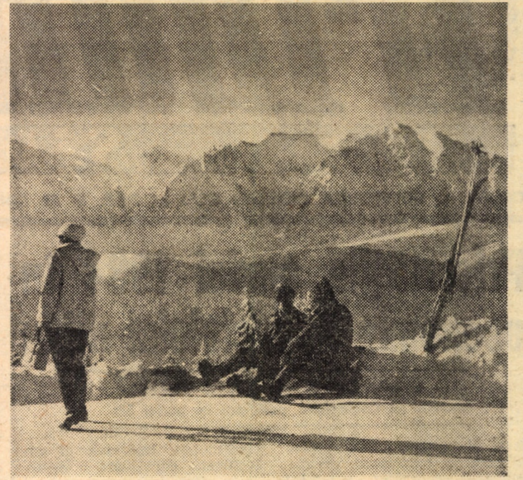
Feerica chemare a muntelui