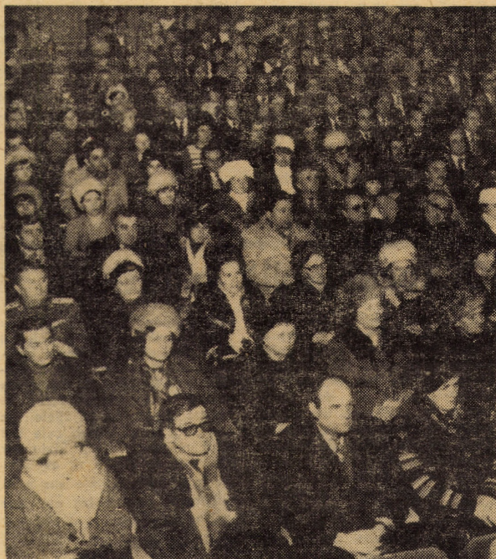
Aspect din sală în timpul desfășurării adunării