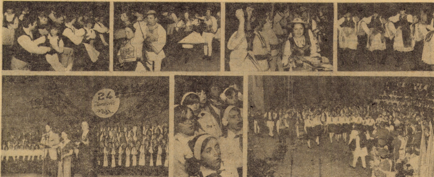
Imagini din spectacolul cultural-artistic

În continuare a avut loc un emoționant spectacol dedicat Unirii la care și-au dat concursul formații artistice și interpreți din județul nostru, premiați la cea de a IV-a ediție a Festivalului național „Cîntarea României”.