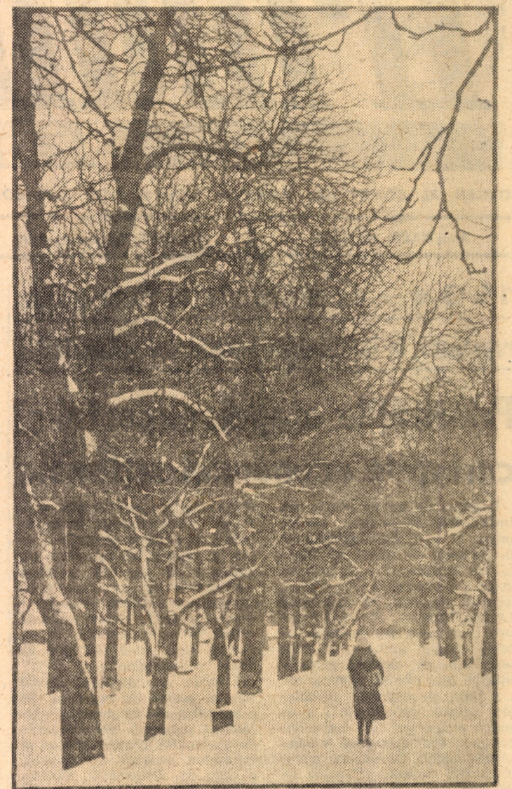
Ceas de ianuarie