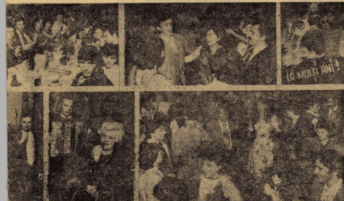
panie a muzicii, dansului și cîntecului, a ei tinerești, o noapte de neuitat. „Garni-osebit de reușit program cultural-artistic,