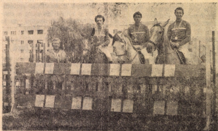
Echipa C.S.M. Sibiu, campioană națională și a Daçiadiei, la proba concurs complet. Reamintim că la recentele finale, disputate în municipiul de pe Cibin, reprezentanții județului Sibiu au cucerit 12 medalii, 5 locuri I, 2 locuri II și 5 locuri III.

Jocurile: Construcții — Record (2—0), Sparta — I.T.A. (1—0) și Relee — Sparta (0—0) au fost omologate cu rezultatul de 3—0 în favoarea formațiilor Construcții, I.T.A. și Relee, deoarece echipele Record și Sparta nu au respectat regulamentul privind utilizarea juniorilor.