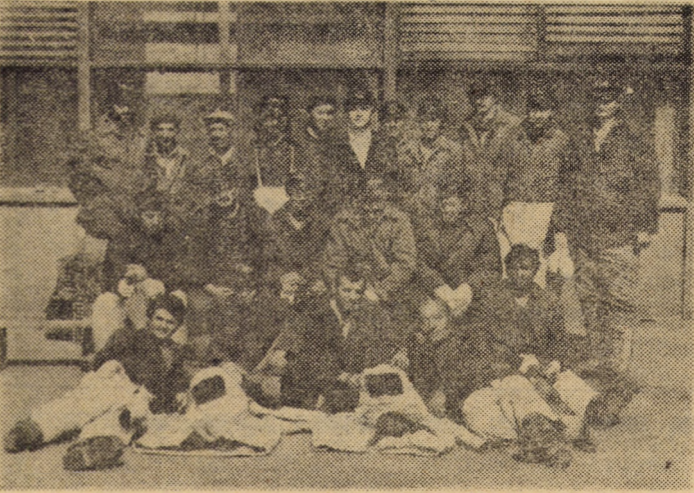
Eroii de la Întreprinderea de geamuri din Medias