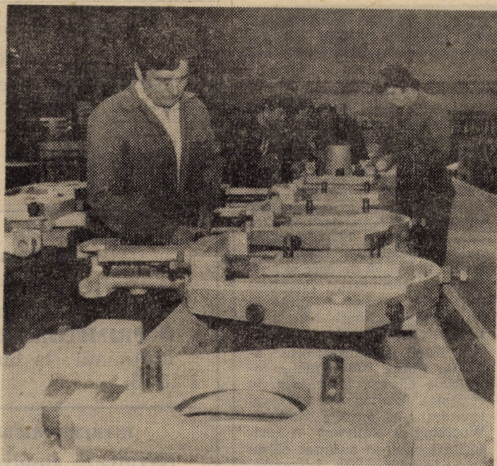
Linie de montaj a subansamblelor pentru utilaje grele în secția mecanică III a întreprinderii „Independența” Sibiu