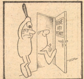
Desen de RUDI SCHMUCKLE

8,00 scol 8,40 tate 9,00 trie 9,30 zici 10,00 11,45 13,00 cal 17,40 rial 18,40 pen 19,00 19,25 țara 19,45 măr Con 20,40 „Pă tivi țară stud ne 22,30 22,30 cii Dumin SIBI Calcu turises 11,15: 0,30 trapt amel 14,30: 26,30 Miste rel 14: 16 pende banca 18: 20 „Fami pe „Br 10: 16 MEI gresul roarce 11,15: 26,30 „Pata rele 1 20,30 Talis dorulu 16: 18 Luni, SIBI „Tess“ orele 19,30. chestra orele 16,30; Tinere cu lib 10: 12 20. „Tubire fote“. rele 10 MEI gresul: rele 9 16: 18. neretu tul gh 10; 20,30. te: „U re“: ot si 20. me (meteo HORS Mîin fi în moasă, riabil, amiază averse sotite cări e va suf peratu vor fi 14 și cele n 26 și 2