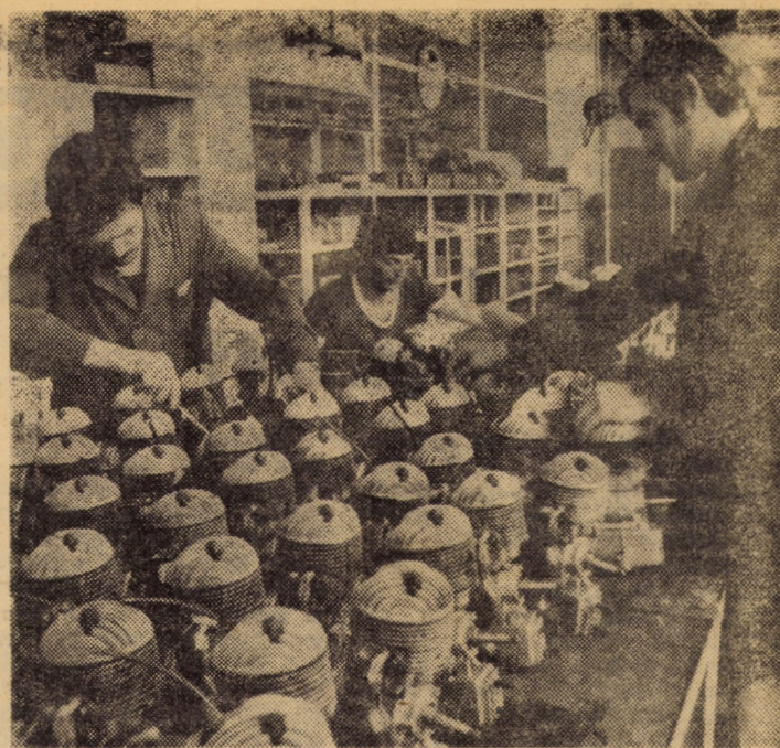
Un nou lot de motofierăstraie „Retezător” este pregătit pentru a fi livrat beneficiarilor. În imagine: atelierul de montaj motofierăstraie al I.U.P.S. Sibiu