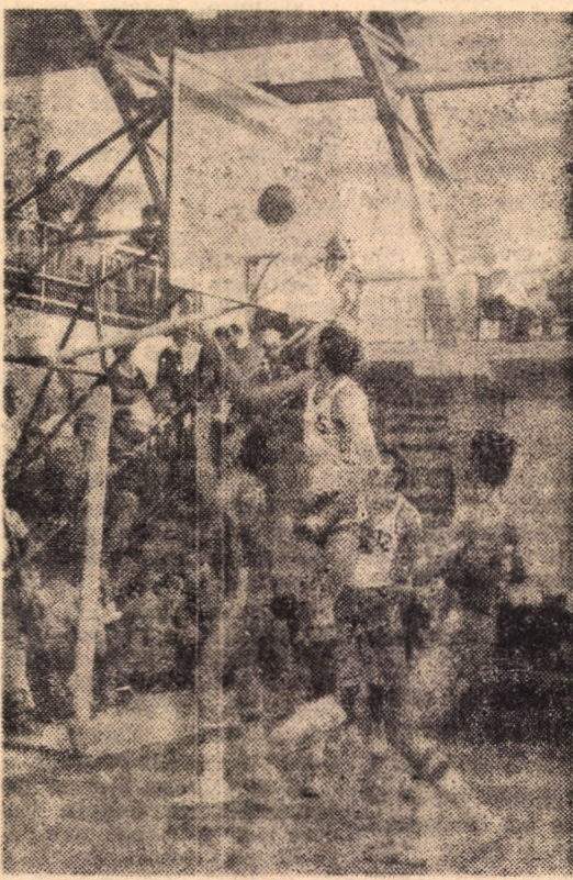
Luptă sub panou în partida: C.S.U. Sibiu — Dinamo Oradea 77—67

Vineri, în ziua a III-a a turneului diviziei A de baschet, grupa 7—12, s-a rezolvat, în sfârșit, problema celei de a doua echipe ce retrogradează în divizia B, alături de Carpați București. Aceasta este Urbis București, care, desi mai spera, în partida cu „U” Cluj-Napoca, într-o minune, ea nu s-a întimplat. Bucureștenii au fost întrecuți la o jumătate de coș: 81—80. Cealaltă partidă, ce prezenta interes pentru configurația clasamentului, dintre C.S.U. Sibiu și Dinamo Oradea s-a încheiat cu o victorie meritată a sibienilor care, de astă dată, au prestat un joc colectiv în adevăratul sens al cuvântului, au „transpirat” pentru fiecare mingă și au punctat în momentele cheie prin Chirilă, Takacs, Palhegy și Apostu (cel mai bun de pe teren). Scor: 77—67 (40—38). Au înscris: Chirilă 32, Takacs 18, Apostu 14, Palhegy 11, Cosma 2. De la oaspeții cei mai buni au fost: Geliert 23, și Szabo 18. Înaintea partidelor de astăzi, care încep la ora 8.30, „U” — Dinamo, Farul — Urbis și C.S.U. — Carpați, clasamentul după trei zile de întreceri arată astfel: 7. Farul Constanta — 78, 8. C.S.U. Sibiu — 75, 9. „U” Cluj-Napoca — 75, 10. Dinamo Oradea — 74, 11. Urbis București — 71, 12. Carpați București — 55. Iată rezultatele penultimei zile: Farul — Dinamo 81—83 (39—39); C.S.U. — „U” 91—81 (47—39); Urbis — Carpați București 73—71 (47—37). ILIE IONESCU