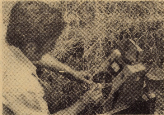
Secvente de campanie care în curînd se vor generaliza pe întreg cuprinsul județului. În imaginile noastre de față țestarea umidității orzului și balotarea neîntîrziată a paielor

(Continuare în pag. a IV-a) NICOLAE IVAN