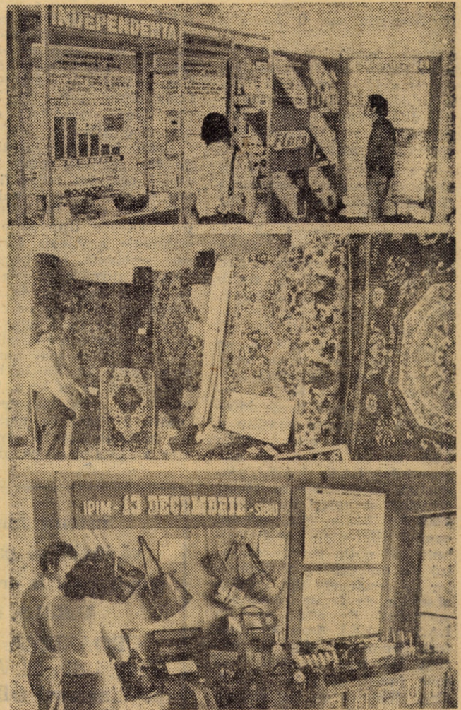
Imagini de la expoziția cu produse realizate din materiale recuperabile, organizată cu prilejul consfătuirii interjudețene