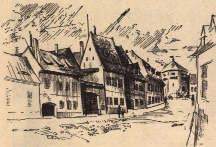
Sibiu, str. R. Korsakov