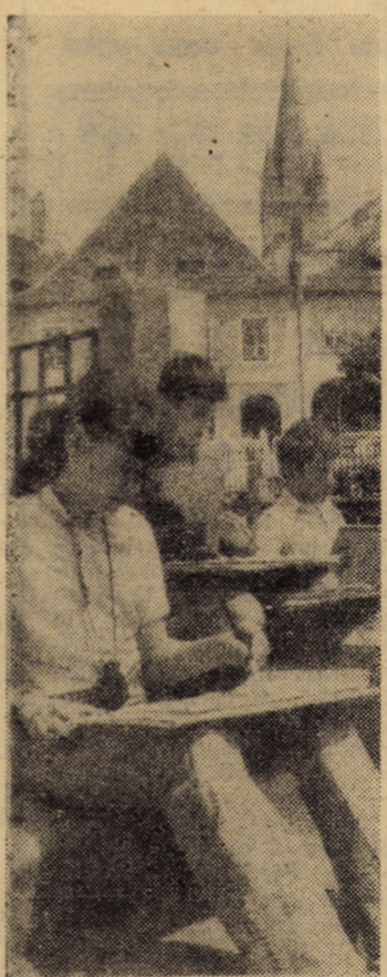
Elevi ai Școlii generale nr. 14 din Sibiu, cu program suplimentar de muzică și arte plastice, inspirîndu-se în lucrări din frumoasa arhitectură tradițională a Sibiului

(Continuare în pag. a II-a) OCTAVIAN RUSU