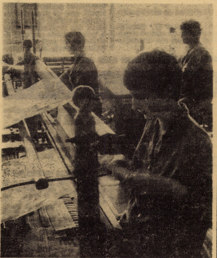
Intr-unul din atelierele secției covor plușat a întreprinderii „Textila” Cisnădie, munca plină de migală a creatorilor de modele se materializează prin perforarea cartelelor conform desenelor, necesare războaielor automate de țesut.