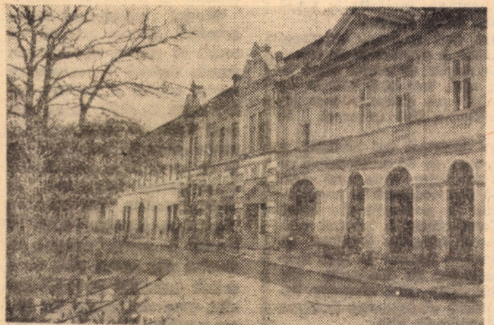
Printre localitățile de pe raza județului nostru, implicate în acțiunile gospodărești de menținere permanentă a ordinii și curățeniei, se înscrie și orașul Dumbrăveni.