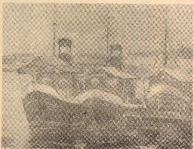
„Vaporașe la Tulcea” (ulei) Ștefan Boca