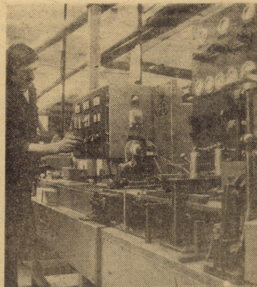
Cu ajutorul acestei linii automate moderne din secția prelucrării mecanice de la I.P.L. Sibiu, secoltur creioane, se execută patru operații consecutive, obținîndu-se într-un schimb cca 170 000 creioane.

(Continuare în pag. a III-a) ION SORESCU