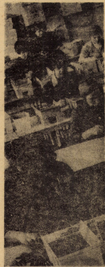
Asamblarea articolelor de scris la întreprinderea „Flamura roșie” Sibiu.

Avem în dotare și o serie (Continuare în pag. a III-a) DUMITRU MANIȚU