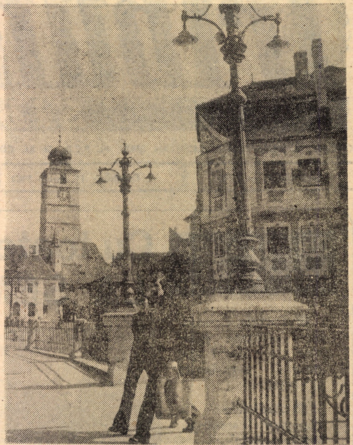
„Exercițiu“ fotografic într-un colt îndrăgit al Sibului vechi