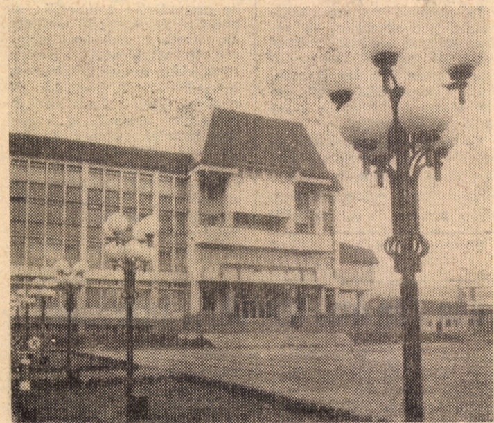
Centrul modernizat al municipiului Medias