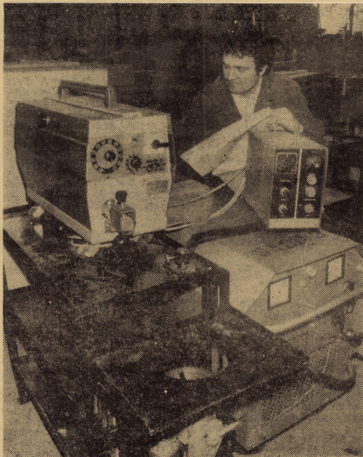
Printre produsele realizate prin autoutilare la I.P.A. Sibiu figurează și instalația de sudură continuă în mediu de CO 2 pentru fabricarea cilindrilor de frînă și amortizoare