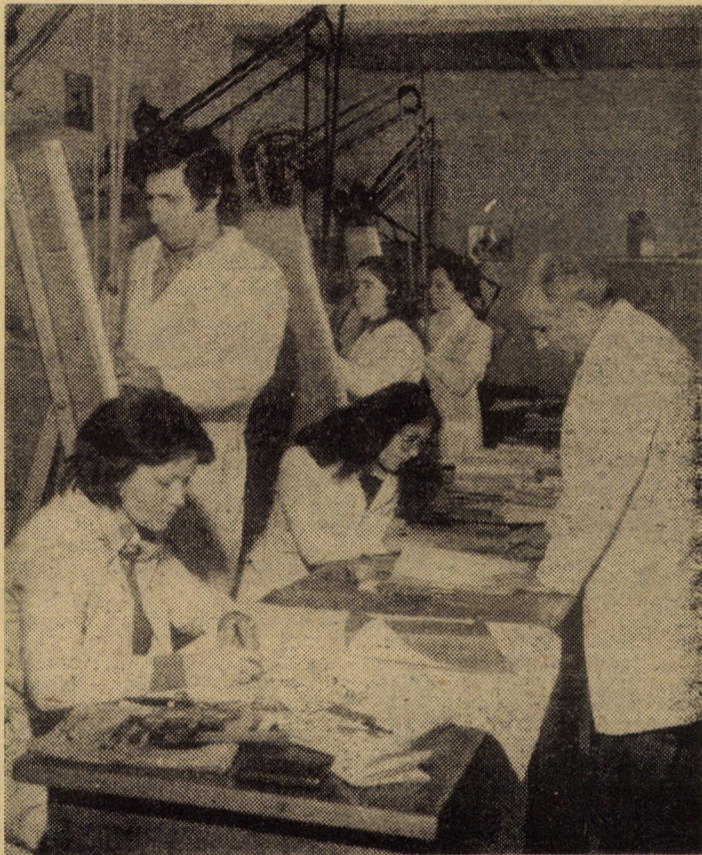
La I.C.S.I.T. Titan, Filiala Sibiu, se depune o activitate intensă pentru definitivarea proiectului la mașinile de confecționat arcuri și rulat tablă groasă

Spiritul revoluționar de gândire și acțiune a impus ca necesitate obiectivă schimbarea în iunie 1919 a denumirii cercurilor „Tineretului muncitor”, în cercurile „Tineretului socialist” și totodată a Mișcării Tineretului Muncitoresc în Mișcarea Tineretului Socialist din România, iar din iulie 1919 gazeta „Foaia tinăru-lui” apare sub titlul „Tineretului socialist”. În august 1919 se des-