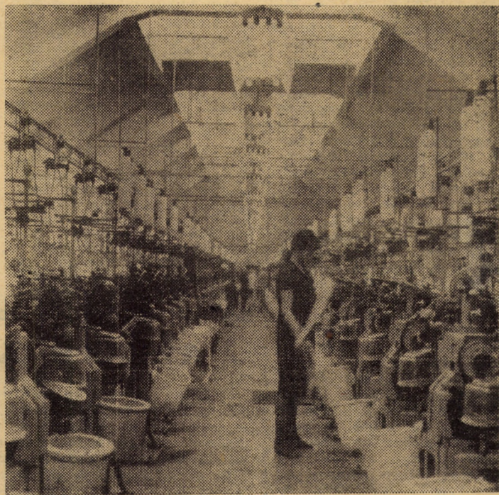
Recent, la întreprinderea „7 Noiembrie” Sibiu, sectorul II, s-a trecut la reorganizarea unor utilaje în atelierul de tricostat ciorapi din fire sintetice, măsură în urma căreia productivitatea muncii a crescut cu 7-8 la sută

(Continuare în pag. a III-a) I. FLESCHEAN