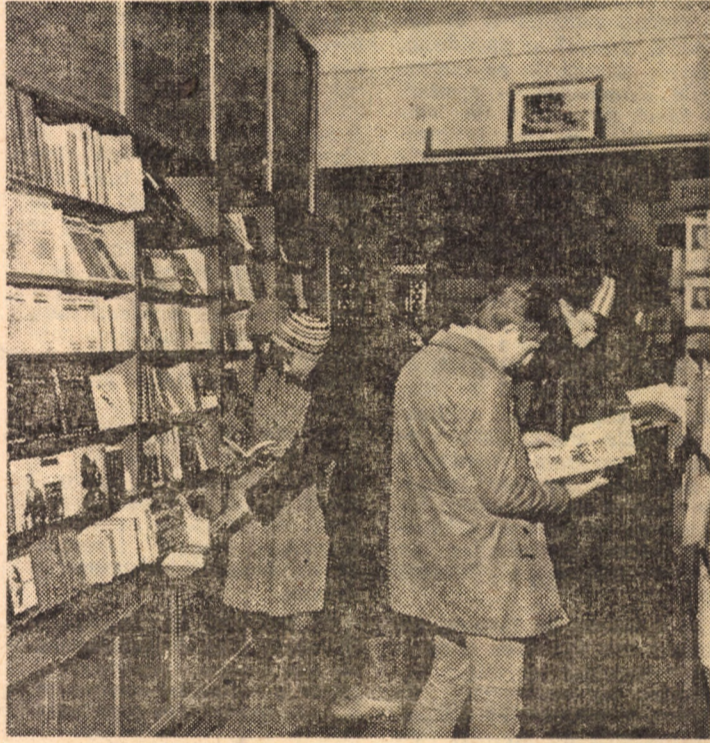
Folosind la maximum spațiul disponibil, recent, la librăria „Dacia” din Sibiu, rafturile de prezentare a cărților au fost supraetajate cu dulăpioare, confecționate în cadrul atelierului de împlănit al Centrului de librării. Menționăm că în anul 1981, această unitate a vîndut cu peste 30 000 cărți mai mult față de anul 1980.

● Sîmbătă, 6.II. și duminică, 7.II. a.c., la Păltiniș va avea loc „Carnavalul tinerețului”. Deplasarea se va face astăzi, 6.II. a.c. cu autobuzul de Păltiniș, la orele 15 și 17. ● Duminică, 7.II. a.c. se organizează o excursie la Agnita cu prilejul „Serbării toalelor”.