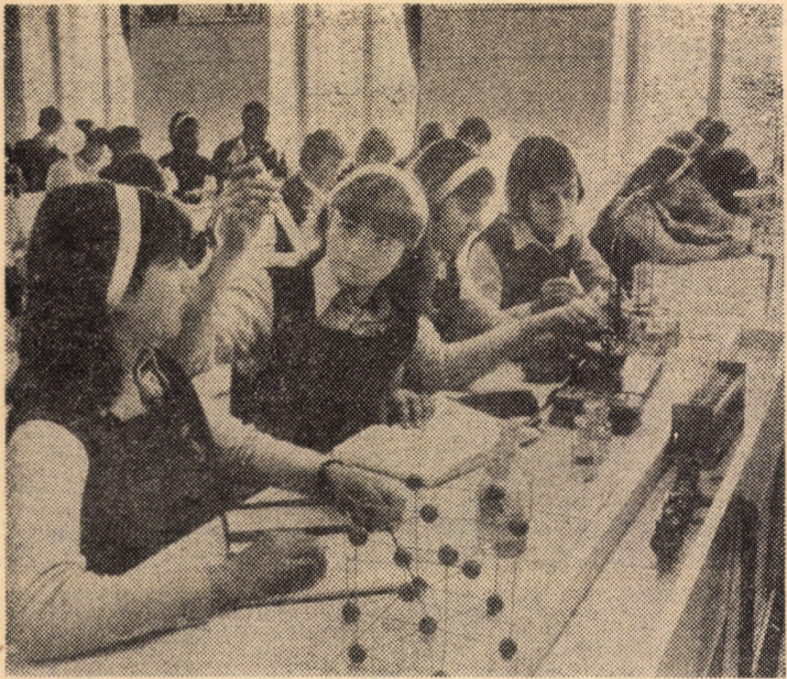
Experiințe în laboratorul de chimie al Liceului industrial nr. 3 Sibiu, recent modernizat