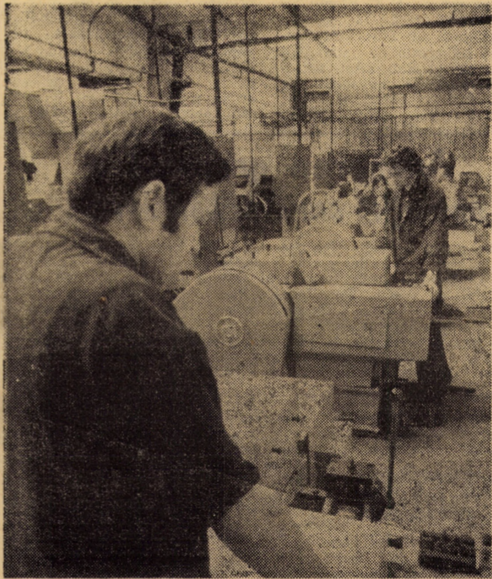
Printre noile capacități de producție, intrate recent în funcțiune în municipiul Mediaș figurează și unitatea a II-a a Întreprinderii mecanice, unde utilaje instalate lucrează la parametrii proiectați