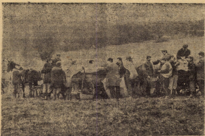
Duminică, pe cgoarele fermei Zăvoi a I.A.S. Ruja, peste 400 de oameni ai muncii din întreprinderile și instituțiile agnigene au culcs porumbul de pe 10 hectare

se strînge din ce în ce mai mult. Dinspre pădure, seceri iuți și harnice culcă-n foșnet cocenii. Cele 5 ha de porumb sint mai gata. Culeg, aici, aproape 100 de oameni de la Cooperativa de consum, spită, școli, Casa pionierilor și mecanici de întreținere de la S.M.A.