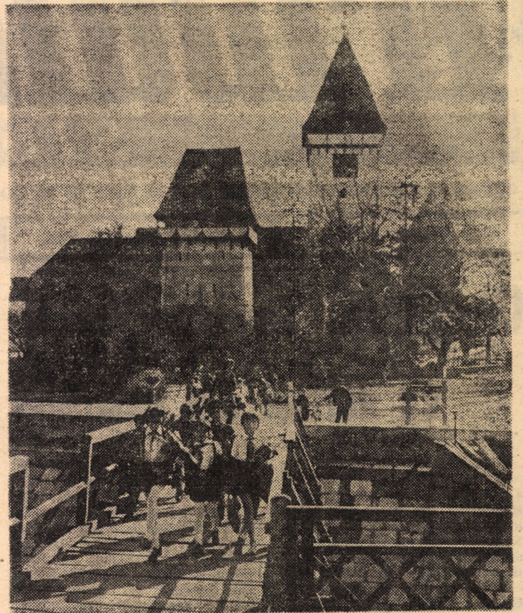
Zile însorite de toamnă peste umbrele turnurilor medievale agnițene